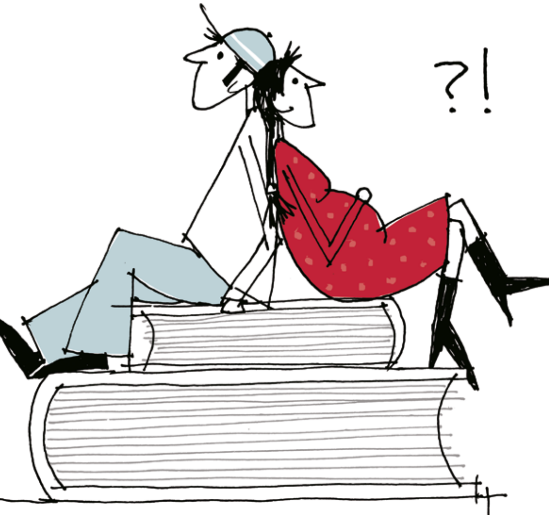
Bild: Elisabeth Friedrich, Fachhochschule München: „Kinder!“ (21. Plakatwettbewerb des DSW)

BERATUNG + BETREU KIND + HOCHSCHULE + STUDENTENWERKE = STUDIEREN + KIND.